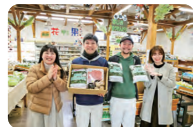
ラジオでPRする生産者とJ A職員

ふれあい産直ショップ花野果は大寒の1月20日、旬を迎えた寒じめほうれんそうと地元食材と一緒に味わえるしゃぶしゃぶセットを限定販売しました。J Aは、寒さで糖度や栄養価が高くなる大寒の日を「寒じめほうれんそうの日」とし、前日の19日にはIBCラジオに生産者とJ A職員が出演し、寒じめほうれんそうのおいしさや特徴などを紹介しました。