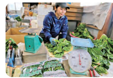
機能性を表記した袋に入れて出荷します

久慈エリアで、寒じめほうれんそうの出荷が11月23日から始まりしました。糖度調査の結果、糖度8以上の出荷基準を満たし「寒じめ宣言」が出され、本年度の出荷が始まりました。JAでは寒じめほうれんそうに含まれ、目の健康維持に効果があるとされる「ルテイン」に着目し機能性表示食品として販売しています。出荷は翌年の2月末までを予定しています。