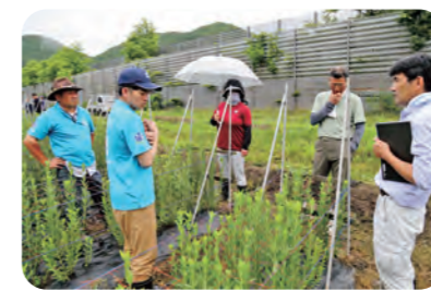
生育状況などを確認する関係者ら

八幡平花卉生産部会は6月29日、同部会役員・りんどう専門部員や関係者ら約50人が出荷最盛期を前に、リンドウの一斉圃場巡回をしました。約140人が生産する「安代りんどう」の全圃場約1 ha を巡回し、生育状況や栽培管理の状況などを確認しました。同部会は、自ら決めた厳しい基準をクリアしたものをだけを「安代りんどう」のブランドとして出荷しています。