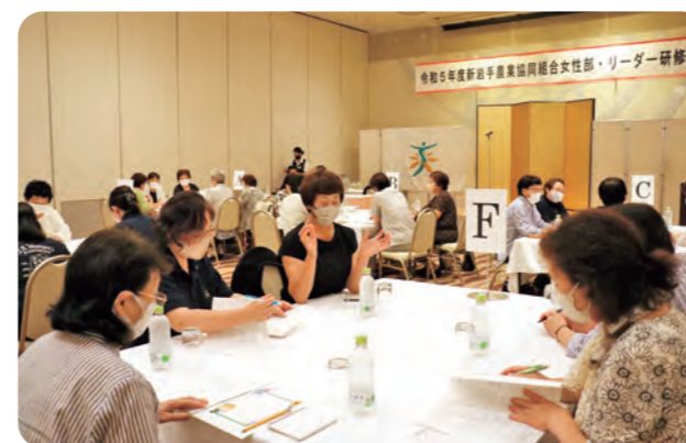
女性部活動について話し合う参加者

J A 女性部は7月19日、盛岡市でリーダー研修会を開きました。各支部から部員44人が参加し、グループワークや講習会を通して部員同士の交流を深めるとともに、今後の女性部活動について意見交換をしました。グループワークでは「楽しく活動し、仲間を増やしていくためには」と題し、各支部の活動を紹介して情報を共有する他、今後の活動についてアイデアを出し合いました。