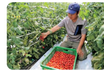
へたを付けずに収穫される「アンジェレ」

宮古エリアで全農ブランドミニトマト「アンジェレ」の出荷が7月上旬から始まりました。へたなしバラ出荷などによる収穫・調整作業の省力が可能。宮古営農経済センターは、土地の少ない地域での施設栽培の品目として令和3年から栽培に取り組み、今年度は6人が17.5 a に作付けしました。全国的に品薄となる夏秋期の産地としての期待も高まっています。