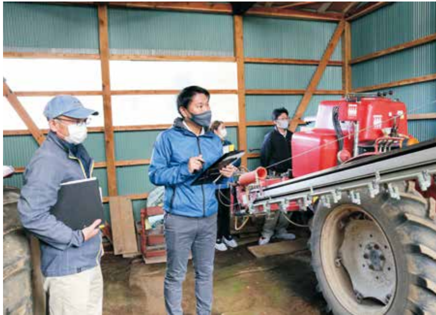
審査を受ける生産者