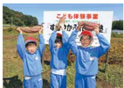
大きなサツマイモを収穫した児童

岩手町立一方井小学校の2年生14人は10月14日、農事組合法人一方井地区営農組合の圃場でサツマイモの収穫体験をしました。5月に児童が苗を植えて育てられ、大きなものや変わった形をしたものなど、真剣な表情で掘り起こしました。大きなサツマイモを収穫した3人には賞状が贈られました。収穫後は用意した焼き芋を味わい、地域農業への理解を深めました。