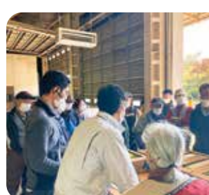
↑北部地域野菜生産部会二戸支部は二戸野菜出荷場でネギ出荷目揃い会を開きました。生産者と関係者ら約25人が参加し、10月下旬からの本格出荷の前に結束位置や長さなどの出荷規格と現在の市況情報などを確認しました。