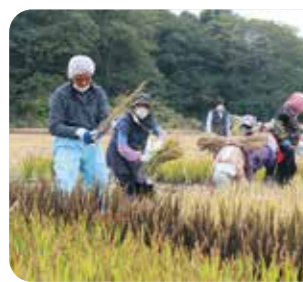
↑岩手町浮島地区の田んぼアートの稲刈りが行われました。浮島地区営農組合と地域住民らが協力し、植え付けた6種類の稲が混ざらないように刈り取りをしました。