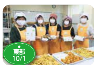
↑JA女性部若手支部は、田んぼアートの稲刈りの参加者に、一方井小学校の畑作体験で収穫した野菜を使った手作り弁当を用意しました。