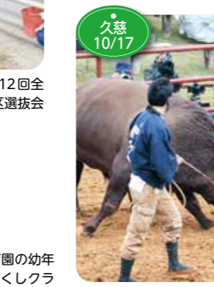
↑東北で唯一の闘牛大会、平庭闘牛大会もみじ場所が平庭闘牛場で開かれました。千秋楽となるもみじ場所の取り組みは10組で2～13歳の牛たちが迫力満点の勝負を繰り広げました。