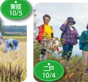
↑JA女性部奥中山支部小鳥谷分会の部員ら12人は、一戸町の西岳の登山にチャレンジしました。JA健康寿命100歳プロジェクトの取り組みで毎年開催しています。