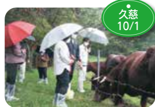
↑首都圏の消費者が久慈を訪れ、久慈市短角牛基幹牧場を訪れ、放牧の様子を見学し、山形村短角牛への理解を深めました。