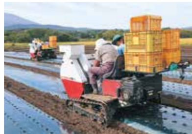
機械で行うニンニク種子の植え付け作業

八幡平市で10月上旬、ニンニク種子の植え付けが最盛期を迎えました。同市は平成29年、県内唯一の在来種「八幡平バイオレット」を種苗登録し、その特徴を生かした1パック包装での出荷を今年度から本格的に始めました。令和5年までに機械による栽培体系を確立し15haに作付けを計画。ホウレンソウ、トマト、ピーマンに次ぐ販売額1億円のニンニク産地を目指しています。