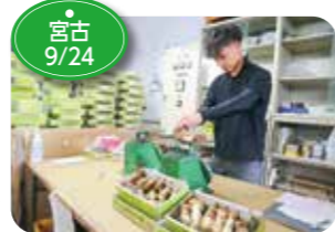
↑宮古地域では、マツタケの出荷が9月上旬から始まりました。例年より早い出荷で9月中旬頃に出荷のピークを迎えました。