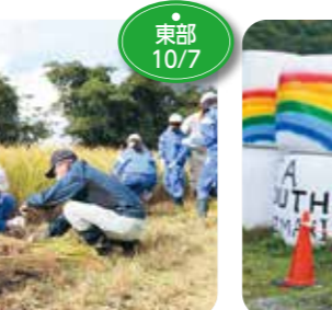
↑葛巻町の酪農、畜産関連の女性で構成するPueraria ones(プエラリエ ワンズ)は9月から10月末まで「牧草ロールアートラリー inくずまき」を開催しました。JAや町、町内の関係団体と協力し、町内6か所に設置した牧草ロールに「元気なくずまき」というテーマからイメージした絵柄を各団体が描き、元気なくずまきを発信しました。