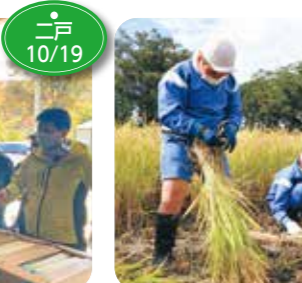
↑盛岡市立浜民小学校の5年生約40人は、市内の農事組合法人「農の未来武道」の水田で稲刈りを体験しました。5月に自分たちで田植えした稲を刈り取り普段食べているお米の生育について理解を深めました。