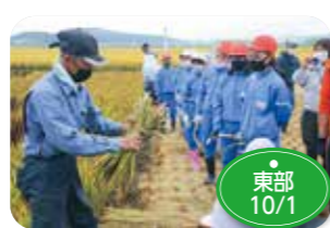
↑岩手町一方井地区の田んぼアートの稲刈りが行われ、一方井小学校の畑作体験で収穫した野菜の5、6年生が手刈りと昔の機械による脱穀に挑戦しました。