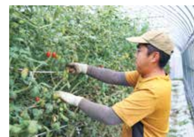
アンジェレを収穫する生産者

宮古エリアでは10月上旬、今年度から取り組む全農ブランドミニトマト「アンジェレ」の収穫が終盤を迎えました。今年から同エリアの生産者5人が11.5aに作付けしました。ヘタなしバラ出荷などによる収穫・調整作業の省力化が可能で、土地の少ない地域での施設栽培の品目としての手応えを感じています。今後は収量の平準化と栽培面積の拡大を進めていきます。