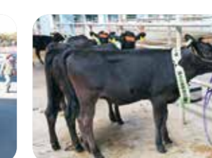
↑栗石町の中央家畜市場で、第12回全国和牛能力共進会第2区・第4区選抜会が行われました。