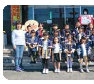
←滝沢市の鶏飼育園の幼年交通安全クラブ「つくしクラブ」の園児が滝沢支所を訪れ、手作りのポスターを手渡し、交通安全を呼びかけました。