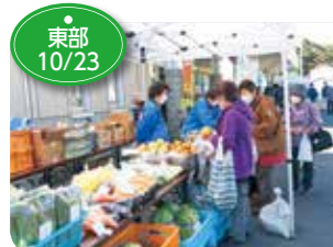
↑くずまき町民まつりが開催され、JA女性部葛巻支部とJA職員が牛乳や新鮮野菜などを販売し盛況でした。