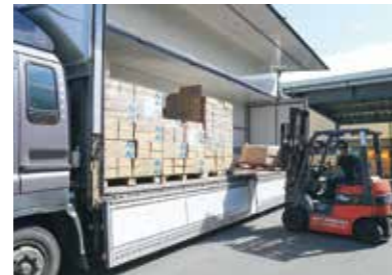
田野畑集出荷場での積み込み作業

久慈エリアの二ツ屋集出荷場で野菜を積んだトラックは宮古エリアの田野畑集出荷場で野菜を積み込み、京浜市場、東北市場を中心に出荷されます。また、新たな輸送ルートを生かすため新たな取引先の開拓をすすめ、販路拡大にもつなげていきます。