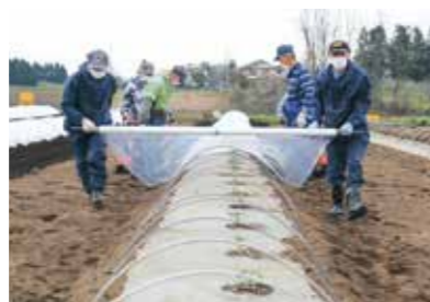
植え付けした苗をビニールで覆う生産者ら

同市は火山灰が広がる水はけがよい土壌条件で、昔からすいか栽培が盛んな地域。植え付け作業は5月上旬に終わり、収穫と出荷は7月下旬から盆にかけてピークを迎えます。