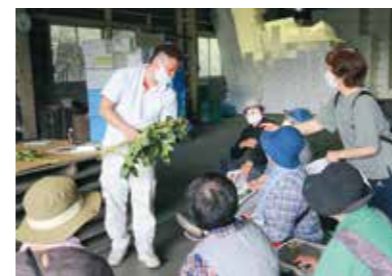
収穫適期を確認する生産者ら

二戸営農経済センターは5月18日、二戸野菜集出荷場でシャクヤク出荷指導会を開きました。生産者11人が参加し、出荷規格、切り前や箱詰め時の注意点などを確認しました。シャクヤクは、既存の花弁品目と作業が被らず、出荷の端境期で市場に出回らないため市場からの要望もあり、新規品目として栽培を始めました。平成30年の秋に定植、今年の5月下旬から本格的に出荷が始まります。