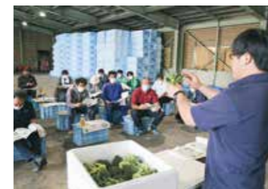
出荷規格を確認する生産者ら

宮古営農経済センターと宮古地域野菜生産部会ブロッコリー専門部は5月25日、宮古市と田野畑村で春ブロッコリーの目揃い会を開きました。生産者や取引市場3社と関係者ら約30人が参加し、出荷規格と今後の栽培管理について確認しました。今年度は久慈地域の生産者を含め31人の生産者が28haに作付けし、昨年を上回る9300万円(前年対比140%)の販売を目指します。