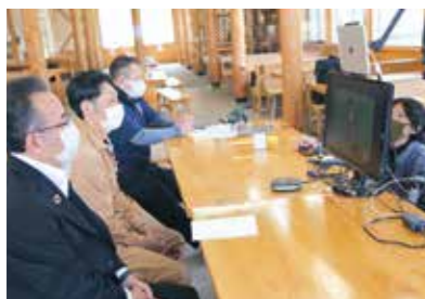
消費者と交流する生産者と関係者ら

参加者は、事前に撮影した山上げの様子を映像で楽しみ、生産者に質問するなど、山形村短角牛の魅力や生産地への理解を深めました。