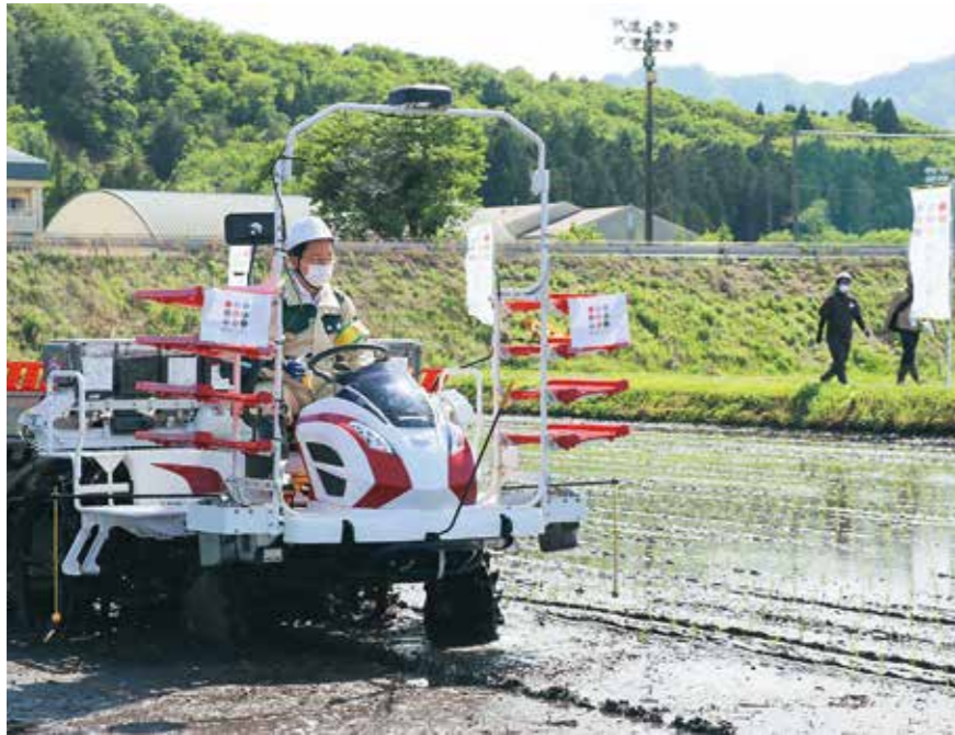
田植え機に乗り田植えをする達増知事