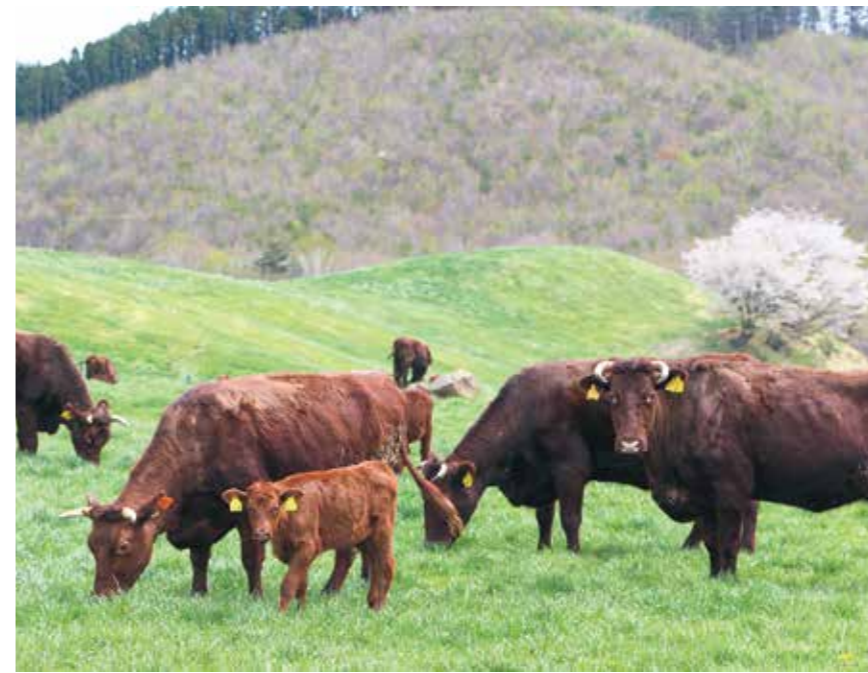
広大な牧場で伸び伸び過ごす短角牛の親子

↑東北唯一の闘牛大会、平庭闘牛大会わかば場所が久慈市山形町の平庭闘牛場で開かれました。土俵デビューとなる2歳牛を含む14頭が出場し、熱い勝負を繰り広げました。次回は6月20日に「つつじ場所」が開かれます。