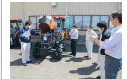
共同購入トラクターの説明を受ける参加者

J Aは5月18日、JA全農いわて営農支援センターで、出向く活動強化に向けた研修会を開きました。TACと経済渉外担当9人が参加し、JAグループが推進するスマート農業や低コスト農業機械などの営農支援対策について学びました。JAはJA全農いわてと協力し初めて開き、多様化する農業経営のなかで最新の技術や取り組みの知識を深め、営農支援の強化につなげていきます。