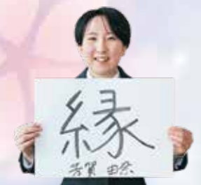
はが ゆな 芳賀 由奈 玉山支所