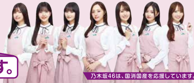
乃木坂46は、国消国産を応援しています。

日本は今、食料の約6割を海外に頼っています。いざという時の食料に困らないために、私たちには何ができるのでしょうか？