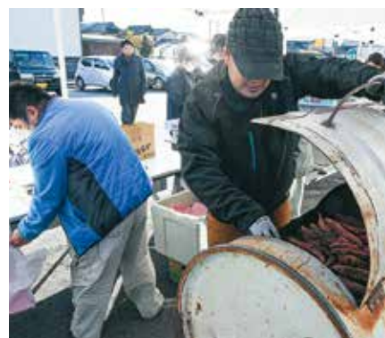
青年部による焼き芋販売の様子